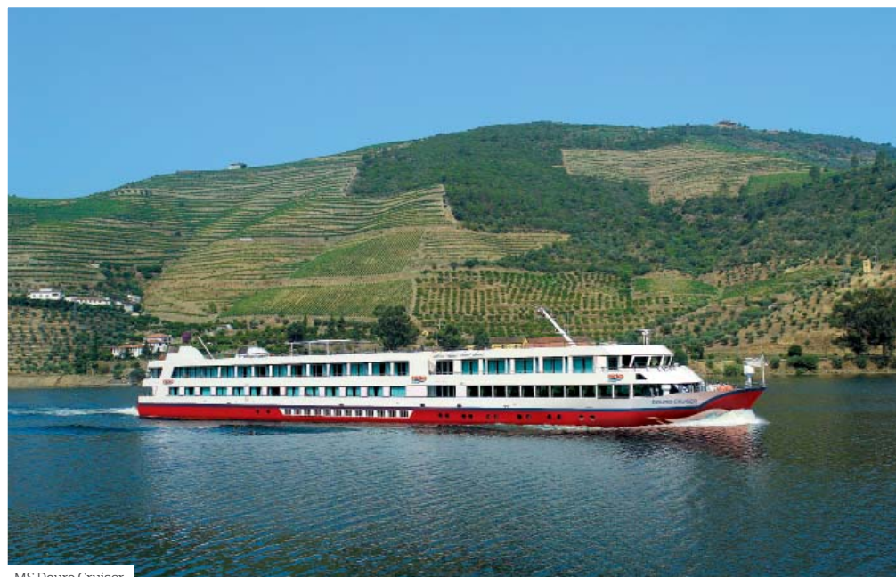
MS Douro Cruiser

Grundprogramm: 20 Personen (muss seitens des Veranstalters bis 28 Tage vor Reisebeginn erreicht werden). 100 Personen für den DERTOUR-Sonderflug.